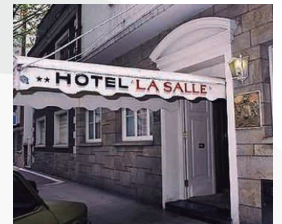
HOTEL LA SALLE