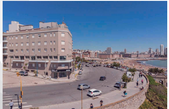
HOTEL PUNTA PIEDRAS